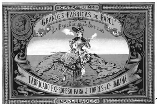
Carátulas de papeleros catalanes 10 : 1. Romaní y Soteras. 2. Mariano Puigdengolas. 3. José Guarro con depósito en Arequipa (Perú)